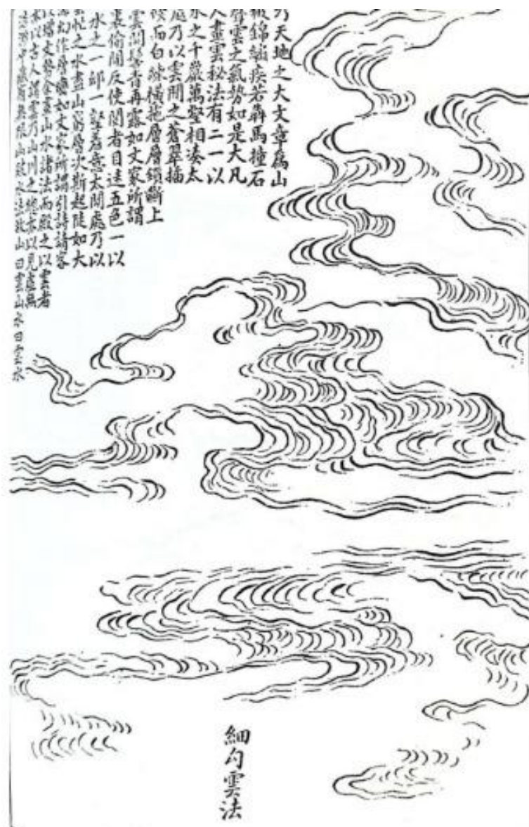
Método de gancho pequeño

Las nubes se solían pintar en contorno, con el método hsi Kou, gancho pequeño, o ta Kou, gancho grande. Se deben utilizar pinceladas finas y curvas que se mueven en una dirección rítmica natural, se debe evitar la uniformidad de la forma y la rigidez de movimiento en el delineado.