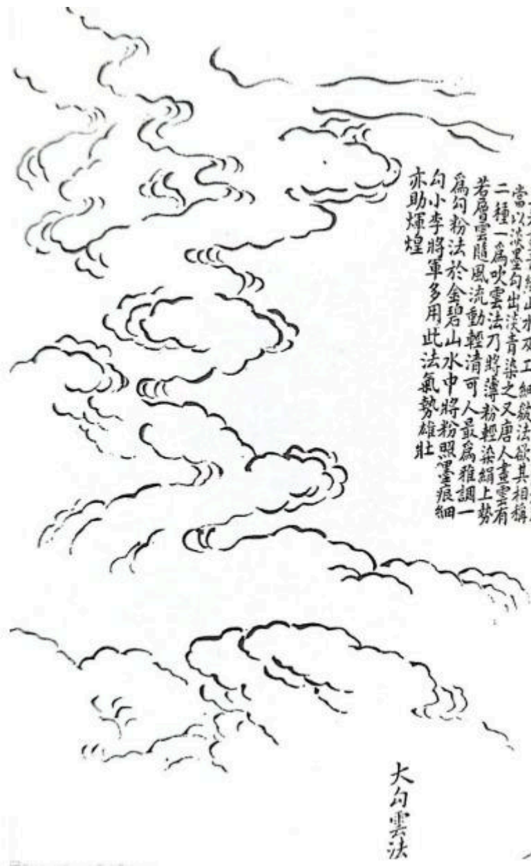
Método de gancho grande